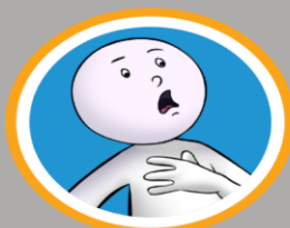
Difficulty in breathing